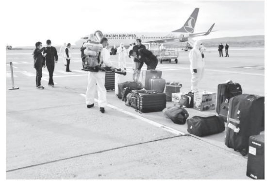
ABD'den getirilen 225 kişi Düzce'de yurda yerleştirildi. İtalya'dan getirilen 194 kişi Karaman'da, Malezya'dan gelen 87 kişi de Aydın'da karantinaya alındı.

KARANTİNADA RAMAZAN NOSTALJİSİ: Öte yandan Samsun'a Almanya ile Ürdün'den getirilen ve 14 günlük karantina sürelerinin dolmasını bekleyen Türk vatandaşlarına, sahurda davullu zurnalı maniler okunarak Ramazan nostaljisi yaşatılıyor. Yurtta kalan vatandaşlar sahura, ramazan davulcusunun mani ve ilahiler eşliğine alkışlarla tempo tutuyor. Samsun'daki yurtlarda Ürdün'den 162 ve Almanya'dan 196 gurbetçi kalıyor. -KARAR